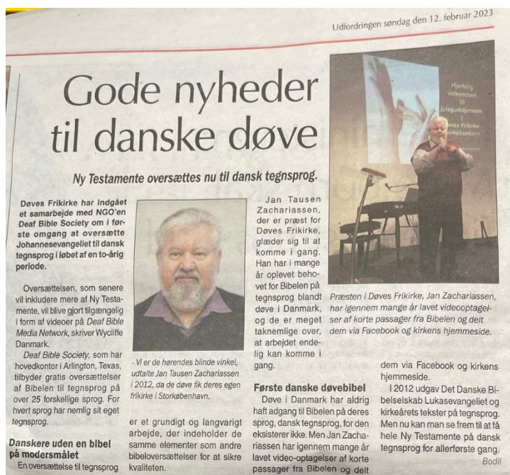
Avisen "Udfordringen" omtalte om vores bibelprojekt!